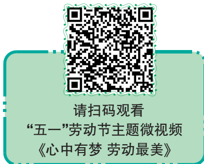
请扫码观看“五一”劳动节主题微视频《心中有梦 劳动最美》